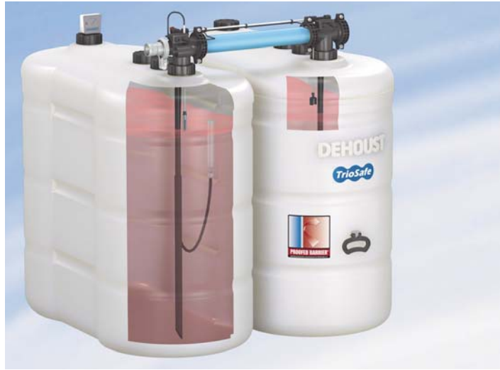
Mini-Batterie aus zeitgemäßen, raumsparenden, doppelwandigen Heizöl-Sicherheitstanks. Gesamtbreite: 1,65 m, Tiefe: 1,56 m. Gesamtstellfläche ohne verringerte Seitenabstände): 2,57 m 2 .

❖ Ein schwimmendes Ölentnahmesystem in jedem Batterie-