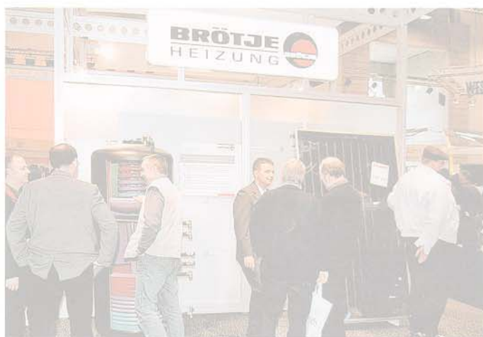
Dem Solarangebot mit Kollektoren und effizientem Schichten-Speicher galt großes Fachinteresse.

stellte Brötje einen Badheizkörper aus, der sich durch sein anspruchsvolles Design, die idealen Werte der Wärmeabstrahlung und höchsten funktionalen Nutzen auszeichnet: BRÖTJE exklusiv, ein gestalterisches Element für das Bad, das sich aber auch im übrigen Wohnbereich sinnvoll und höchst dekorativ einsetzen lässt. Die Kombination von geraden und nach vorn gewölbten Profilen bietet die Möglichkeit, Textilien bequem zum schnellen Trocknen aufzuhängen. Diese Anordnung erhöht darüber hinaus den Wärmefluss und erreicht damit höchste Wärmeleistung.