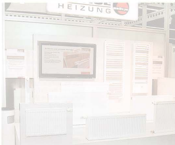
Ob Flachheizkörper oder Design-Badheizkörper, sie alle zeichnen sich durch einfache und schnelle Montage aus.

Wesentlich ist allerdings die Bodenverankerung: Jeder Einzeltank wird links und rechts am Boden verankert. Massive