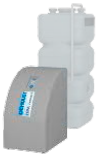
Haube aus recyclingfähigem EPP für Schallschutz