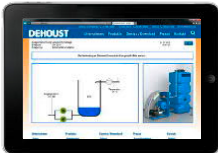
Screenshot der Benutzeroberfläche