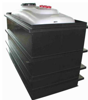
HD-PE Tank in Auffangwanne