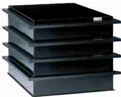
Auffangwanne für HD-PE Tank