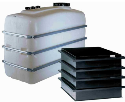
HD-PE Tank und Auffangwanne