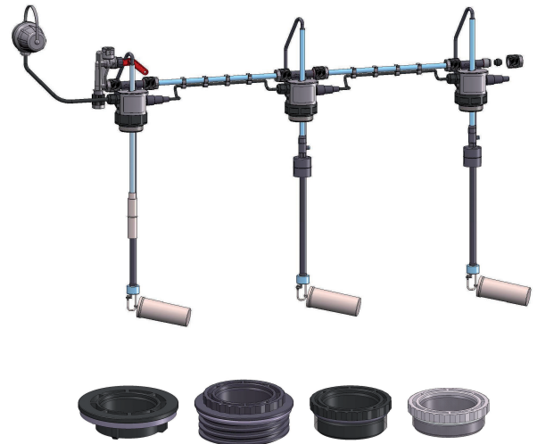
Enthaltene Adapter: Tellerflansch Ø=68mm, Gewindeflansch G2 / M 60x4 / S 75x6

Zur bauseitigen Verbindung zwischen Grundeinheit und der GWG-Armatur für Wandmontage wird ein Feuchtraumkabel H05VV-F 2x1 mm 2 benötigt.